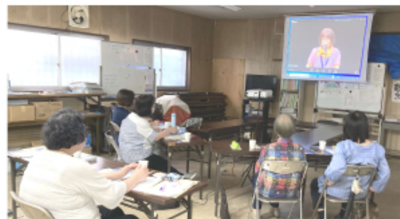
民商事務所でオンライン参加の様子